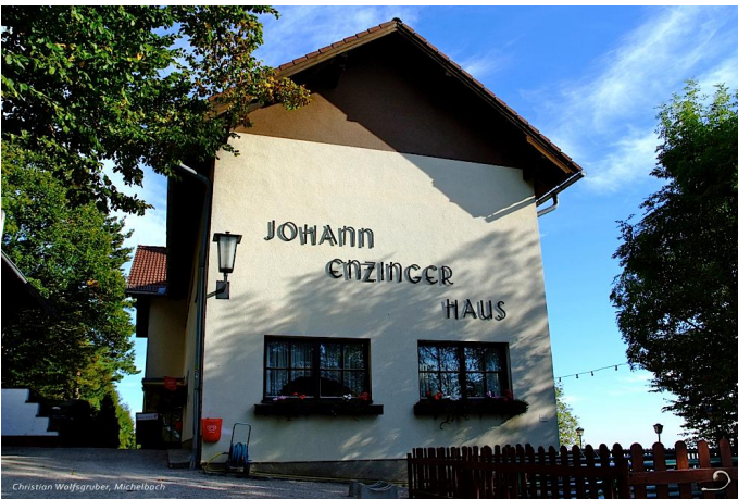
Johann Enzinger Haus am Hegerberg