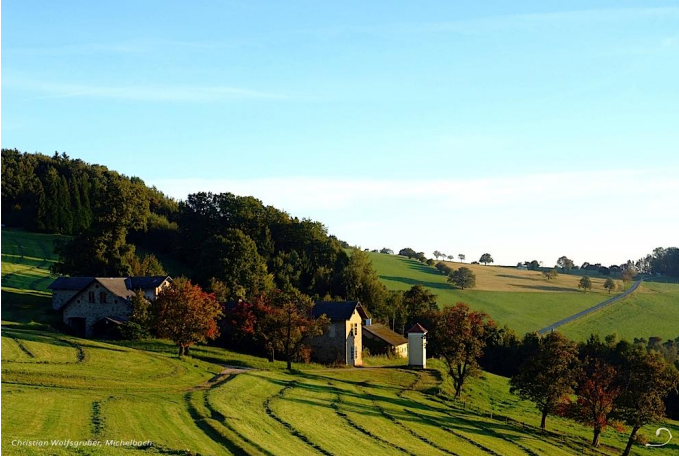
Josefshaus oberhalb des Klosters