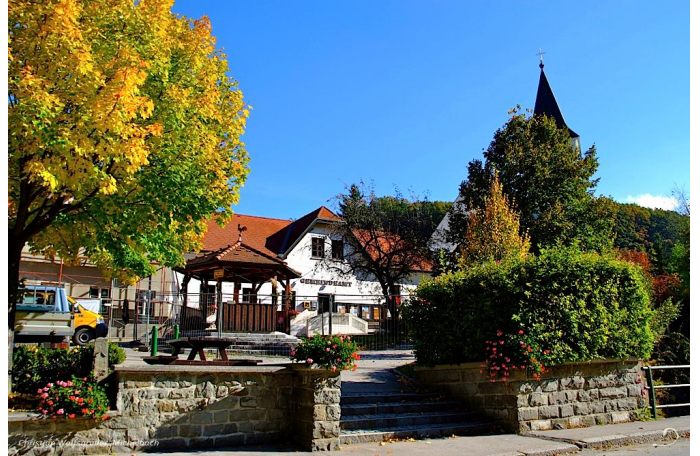
Hauptplatz von Stössing